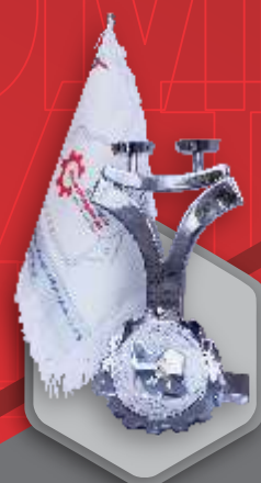
تندیس استاندارد واحد نمونه ملی